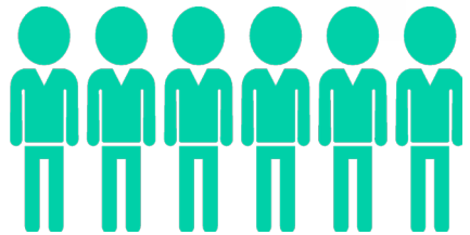
675 бүртгэлтэй ажилгүй иргэд

Аймгийн хөдөлмөр эрхлэлтийн албанд бүртгэлтэй, ажил идэвхитэй эрж байгаа ажилгүйчүүд 2019 оны 6 сард 675 иргэн байна.