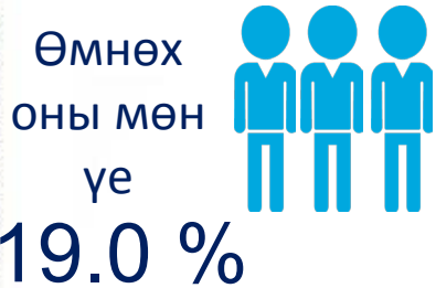
Өмнөх оны мөн үе 19.0 %

Аймгийн хөдөлмөр эрхлэлтийн албанд бүртгэлтэй, ажил идэвхитэй эрж байгаа ажилгүйчүүд 2019 оны 6 сард 675 иргэн байна.